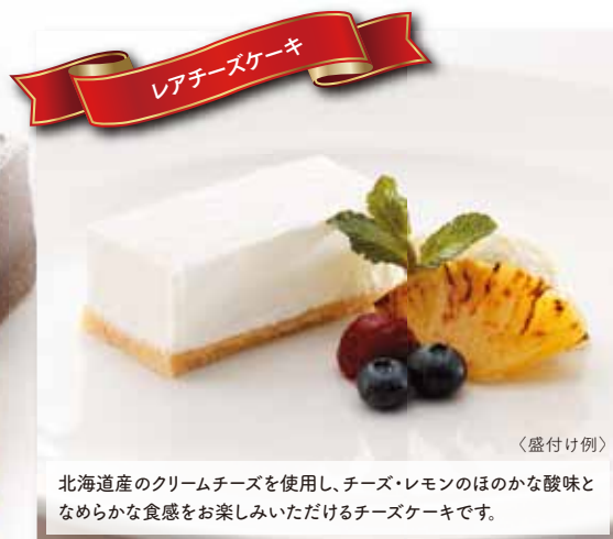
レアチーズケーキ