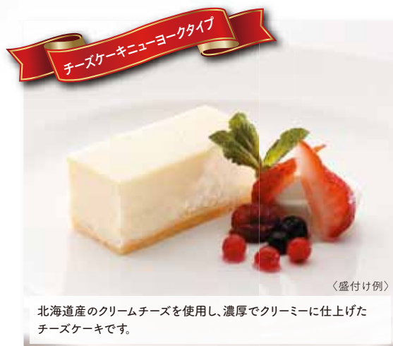
チーズケーキニューヨークタイプ

ブリュレとはフランス語で「焦がす」という意味です。丁寧に手作業で 表面を焦がした、チーズケーキです。