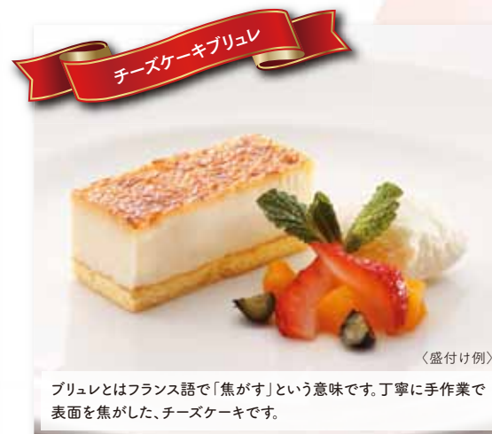
チーズケーキブリュレ

北海道産のクリームチーズを使用し、チーズ・レモンのほのかな酸味と なめらかな食感をお楽しみいただけるチーズケーキです。