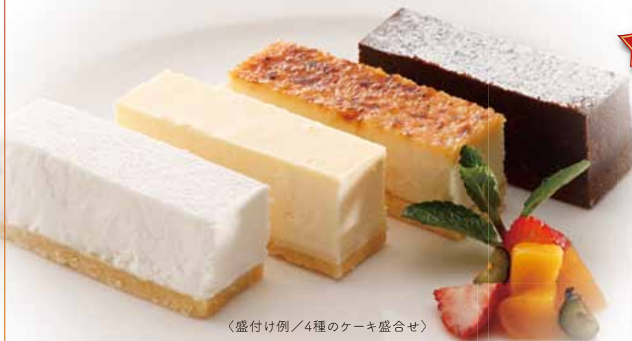
〈盛付け例／4種のケーキ盛合せ〉

北海道の春雪さぶーる・小樽工場で製造している、冷凍ケーキです。 チーズケーキは北海道産の生乳を使用したクリームチーズを使っております。 人気の4種類の味をセットにしました。 食べやすいサイズにカット済み(6切入り)です。